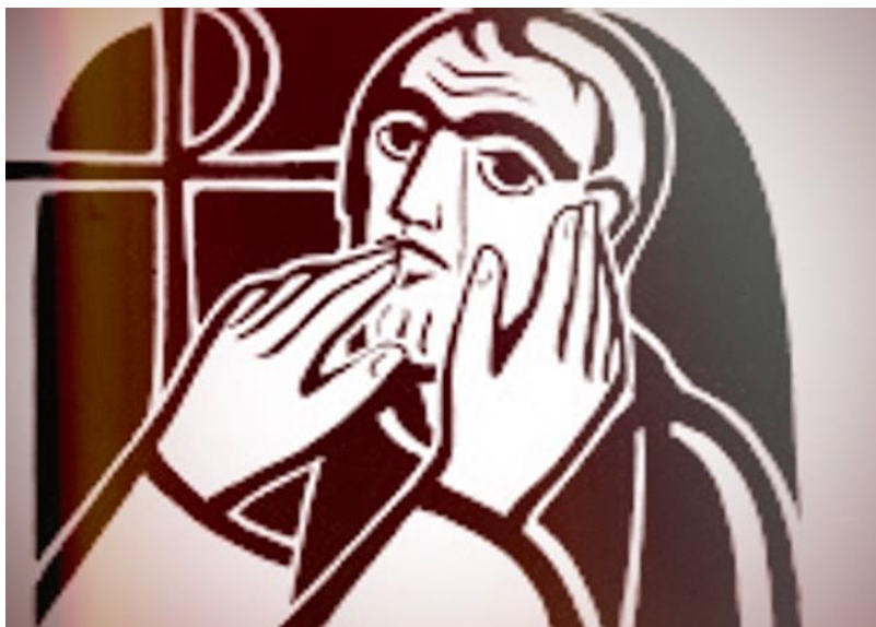
Bild: Die Heilung des Taubstummgen