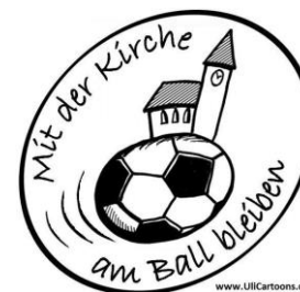
www.UllCartoons.de Bild: Ulrich Wörner

Bald schon ist Weihnachten... Unser Pfarrteam ist bereits jetzt schon tief in der Planung und Vorbereitung für die zweite Jahreshälfte und somit auch für die Advents- und Weihnachtszeit. In den Sommerferien werden wir die Zeit nutzen und Ideen und Pläne konkretisieren. Wenn Sie Angebote für Ihre Gruppen oder die Gemeinde machen möchten, dann teilen Sie uns diese bereits jetzt sehr gern mit, um Terminüberschneidungen zu vermeiden.